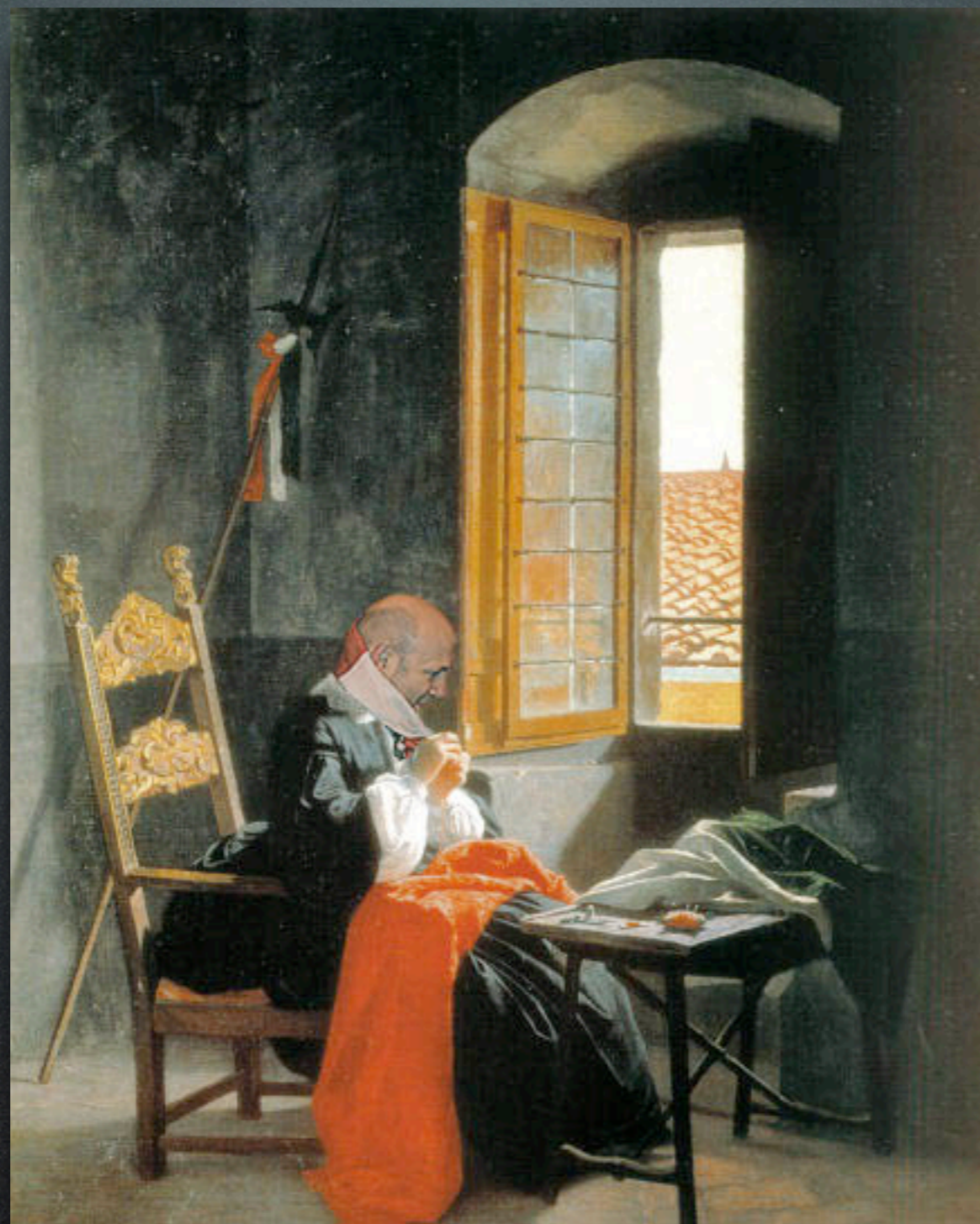
Odoardo Borrani - Il 26 aprile 1859 (1861)