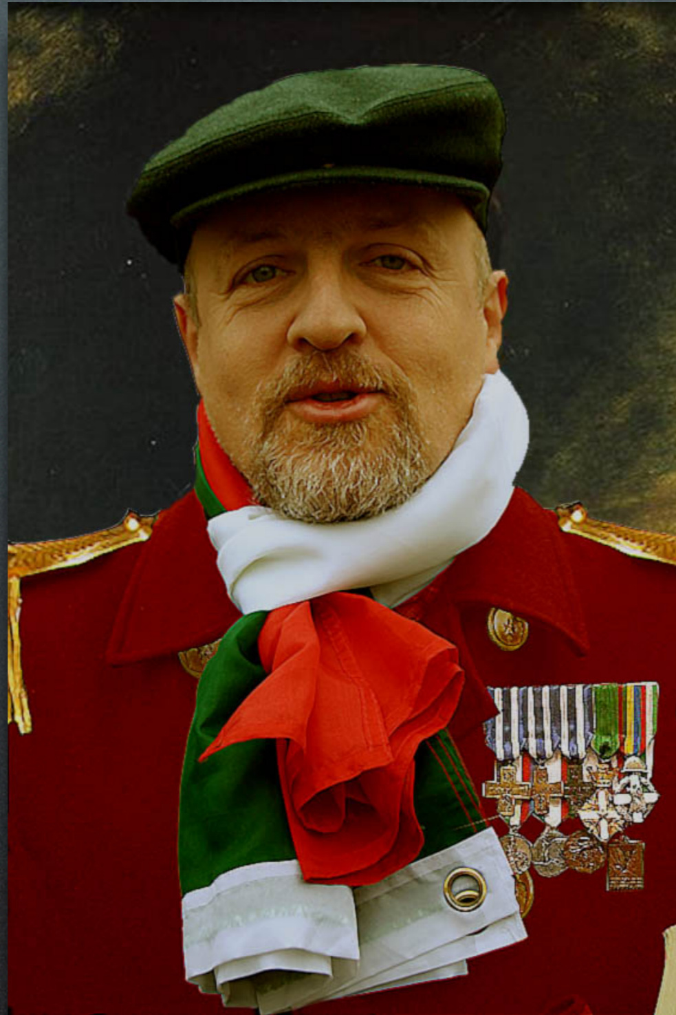
Anonimo - Il Generale dei Garibaldini (1861)