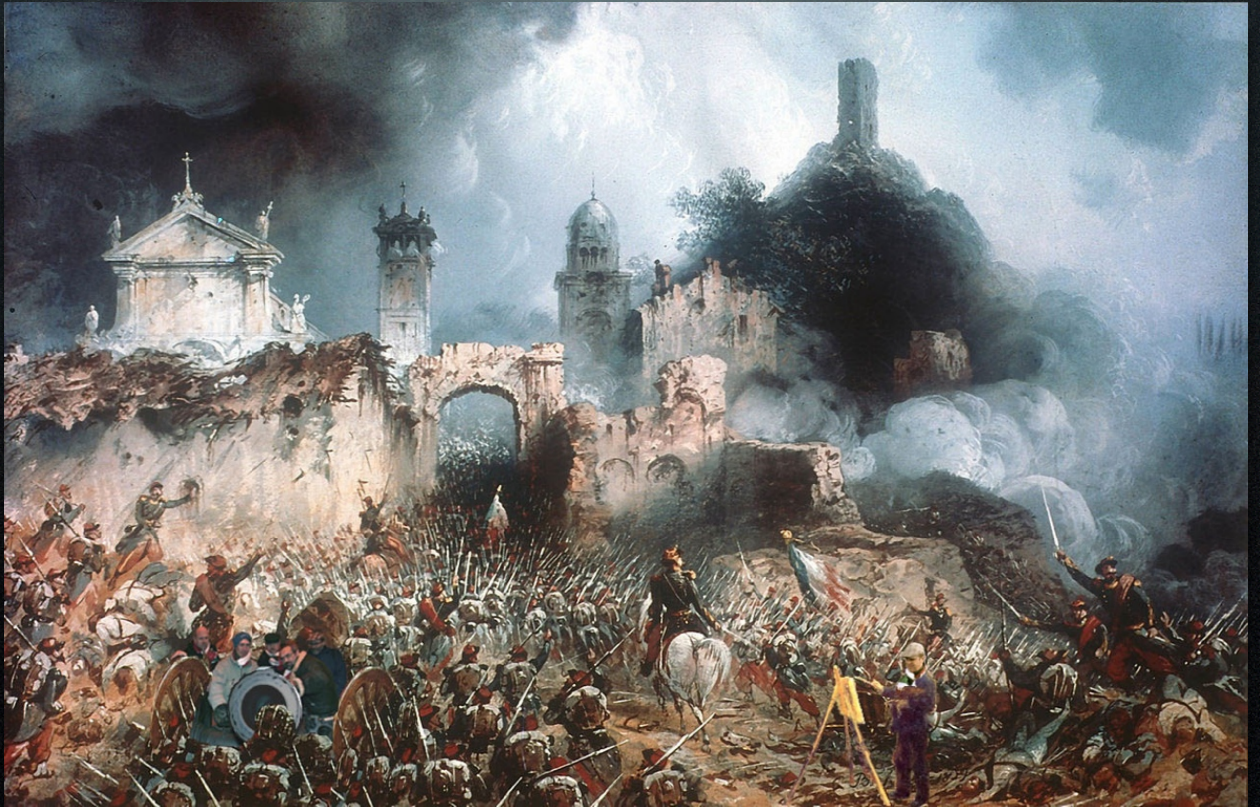
Carlo Bossoli - Battaglia di Solferino (1859)