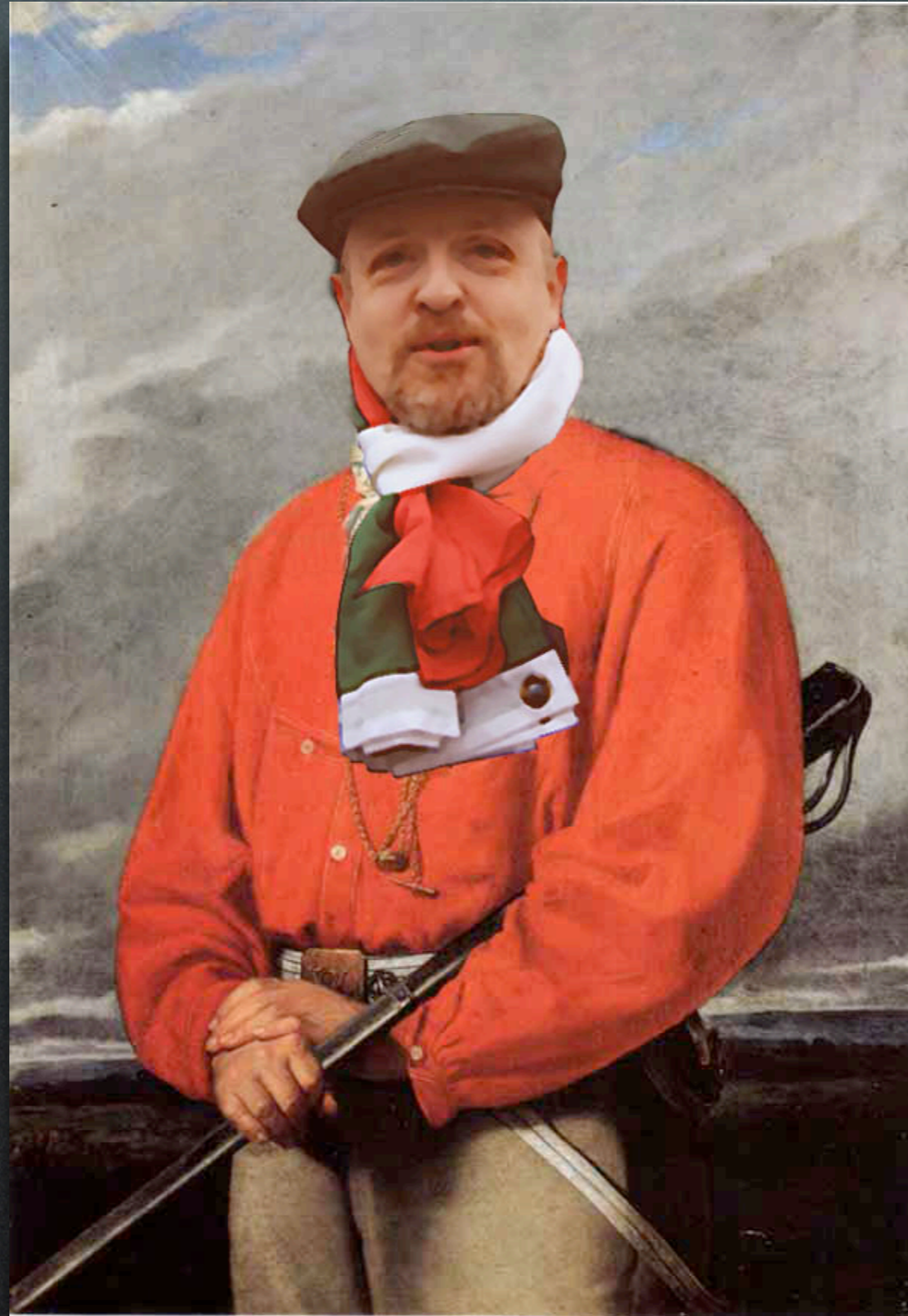
Silvestro Lega - Ritratto di Giuseppe Garibaldi (1861)