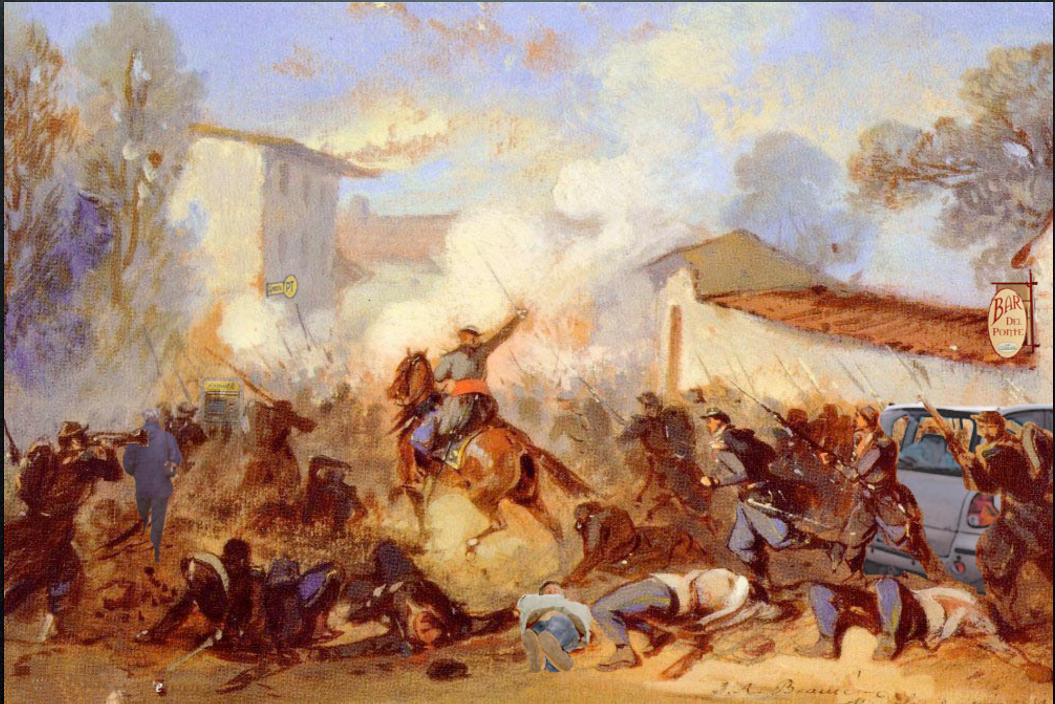
Jean Adolphe Beaucé - Battaglia di Medole (1860)