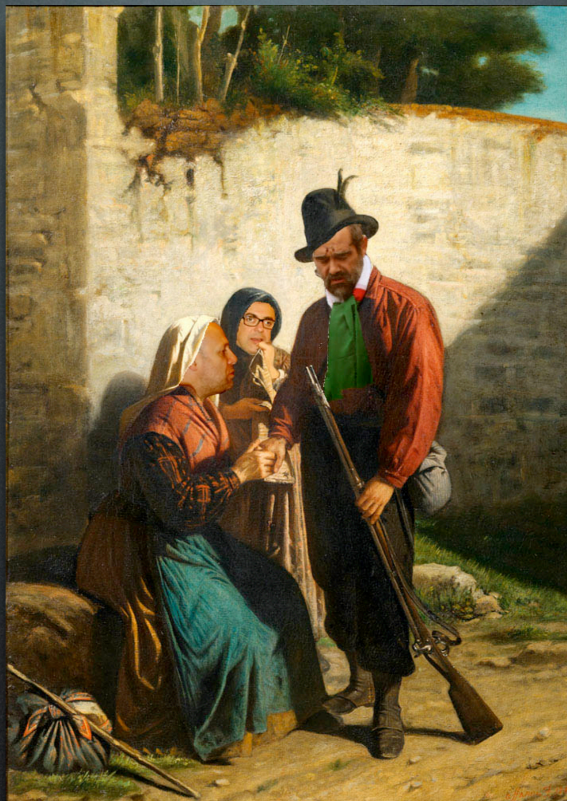
Ignazio Affanni - La partenza del garibaldino (1859)