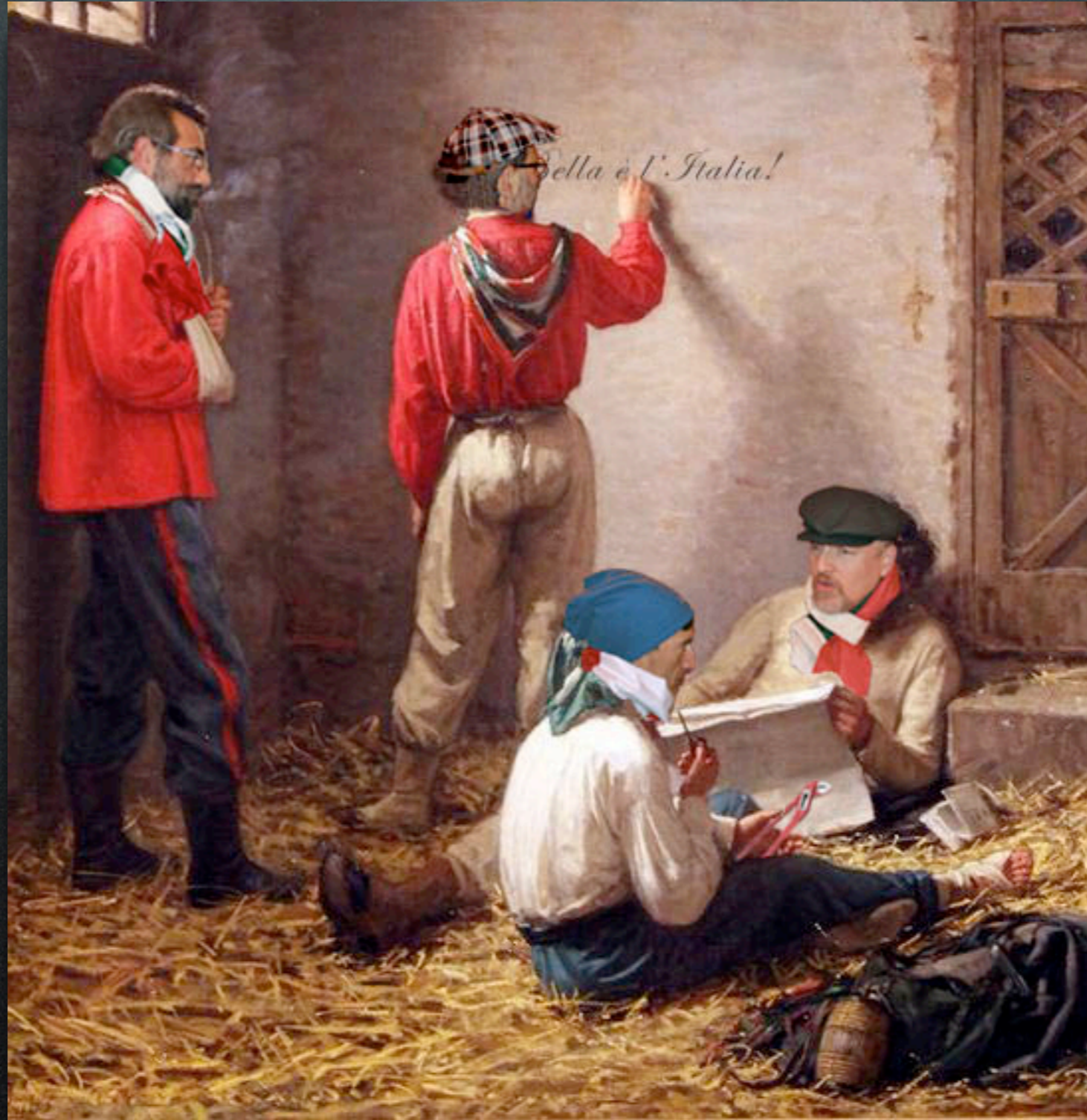
Gioacchino Toma - O Roma o morte! (1863)