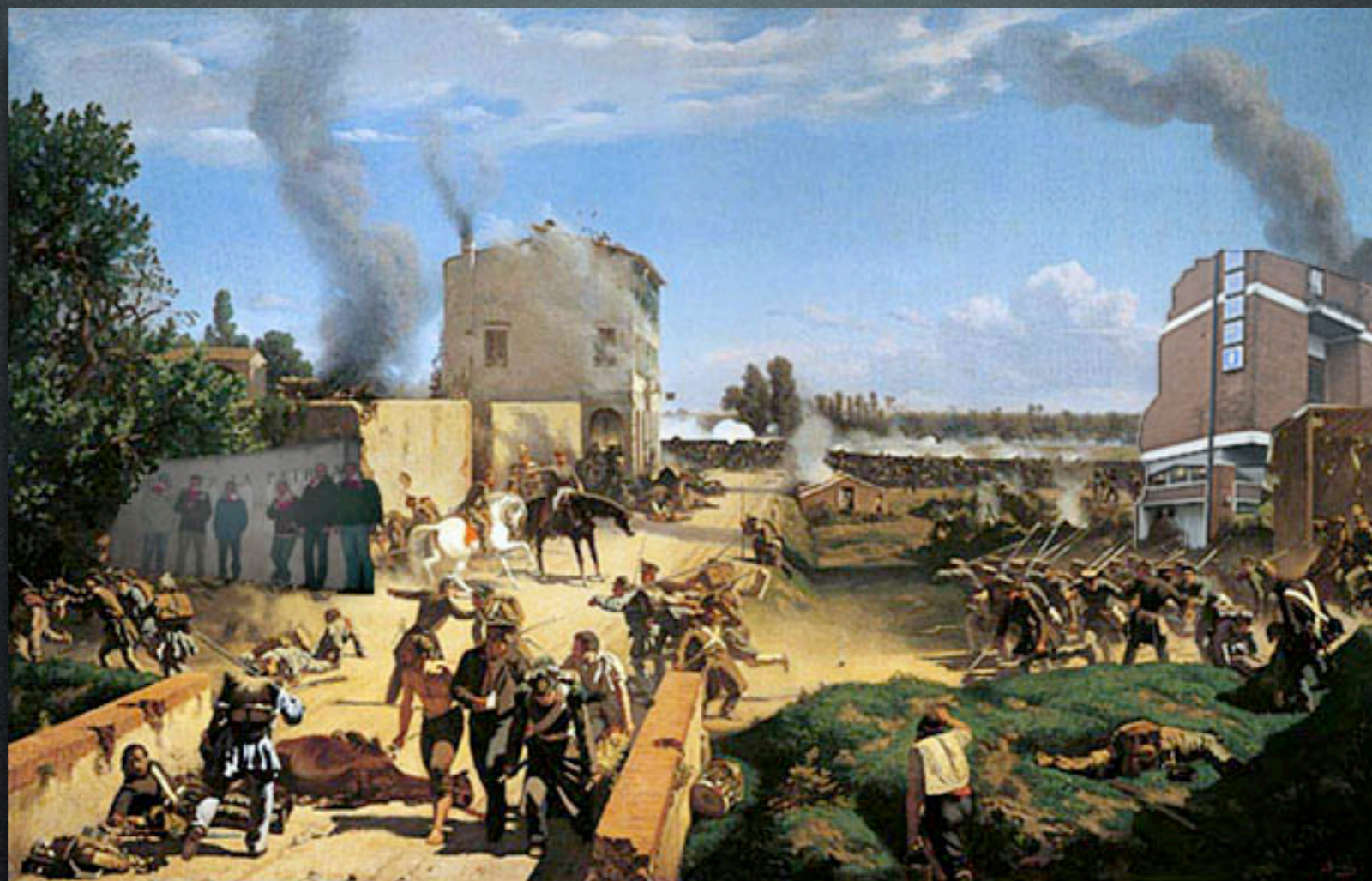
Pietro Senno - I toscani e gli umbri a Curtatone e Montanara (1861)