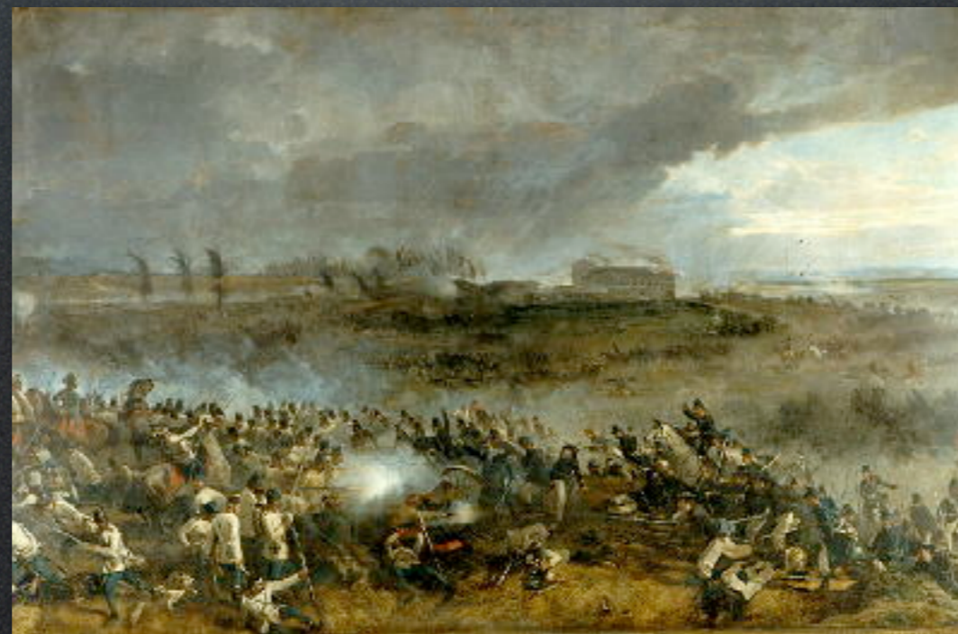
Jean Adolphe Beaucé Battaglia di Medole