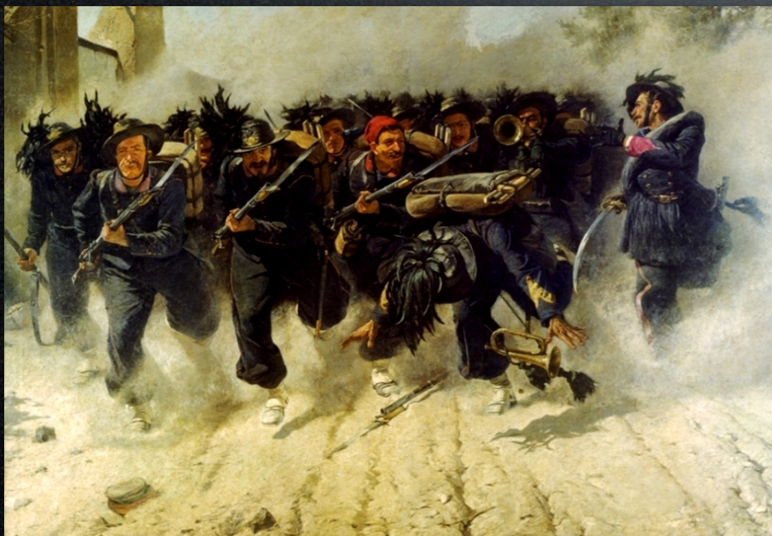
Gioacchino Toma O Roma o morte!