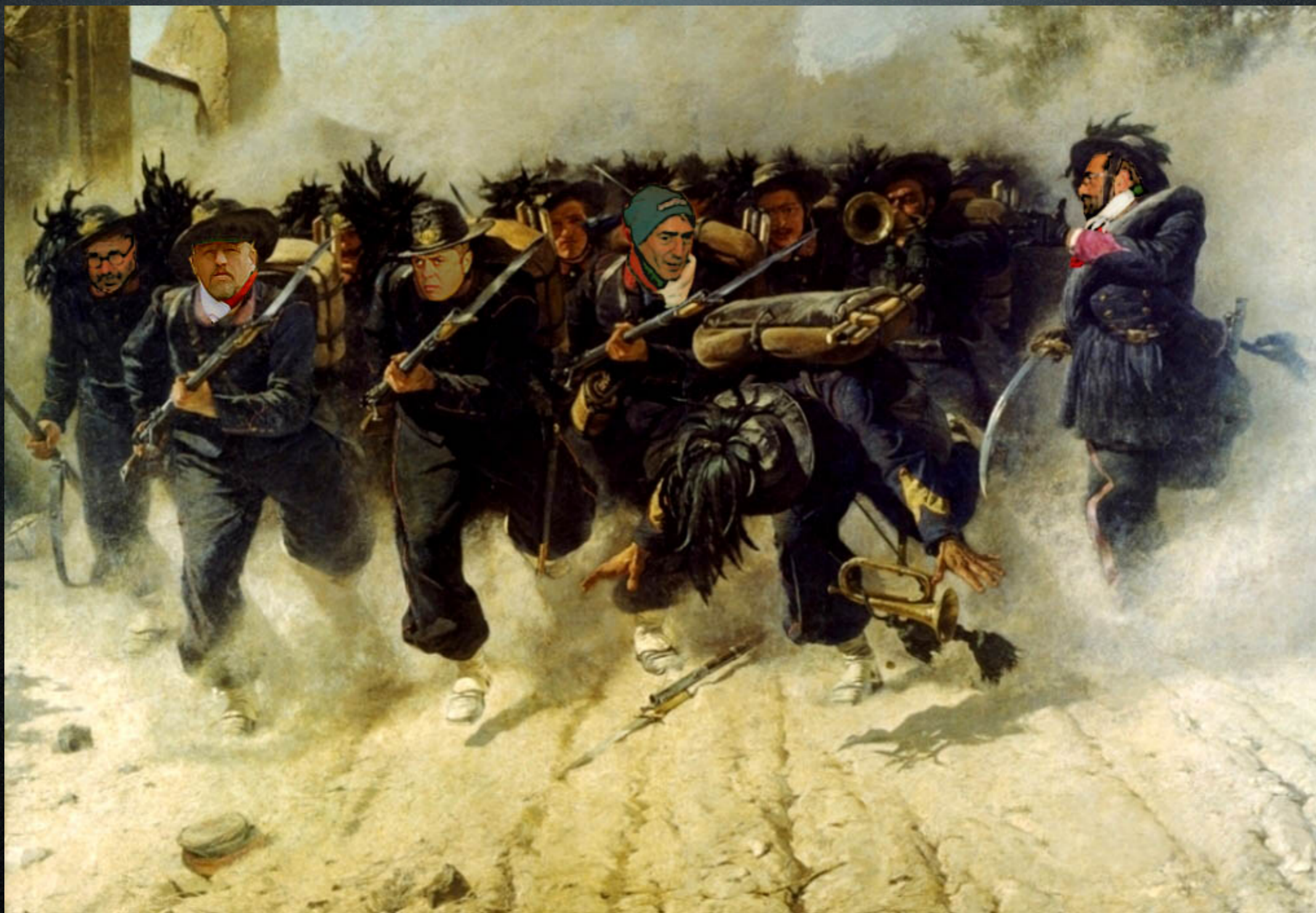
Michele Cammarano - La carica dei bersaglieri (1871)