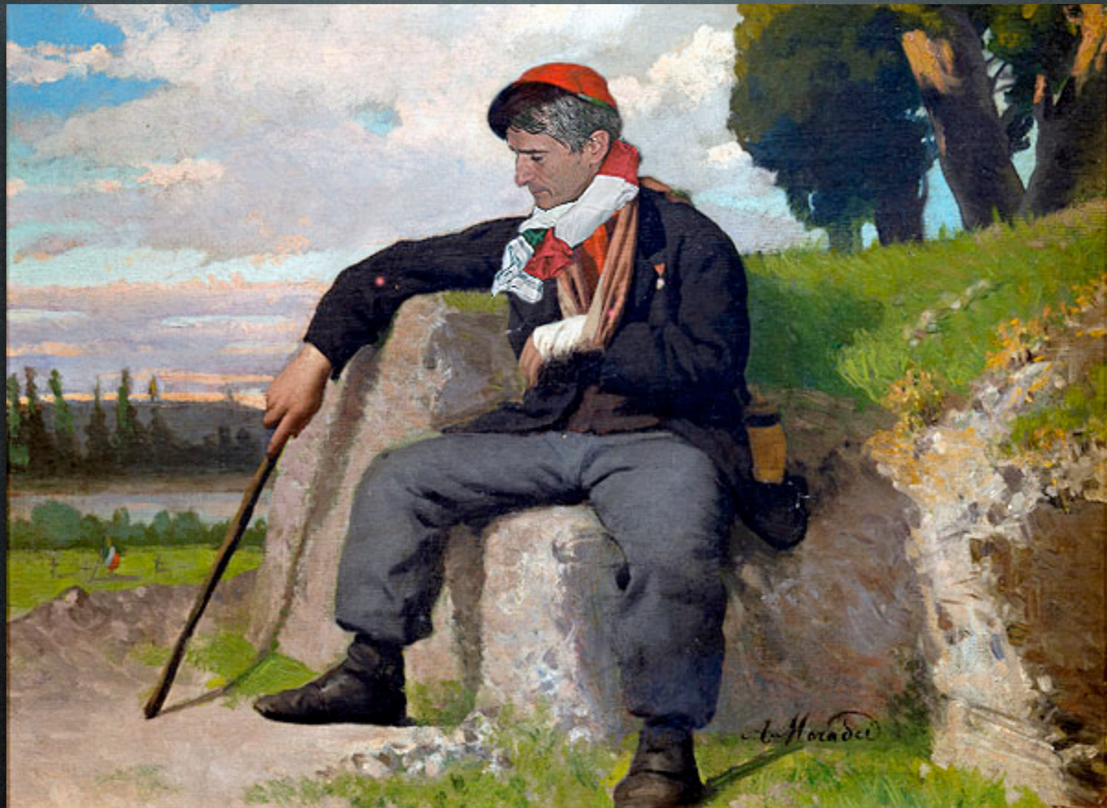
Arturo Moradei - Il garibaldino ferito (1866)