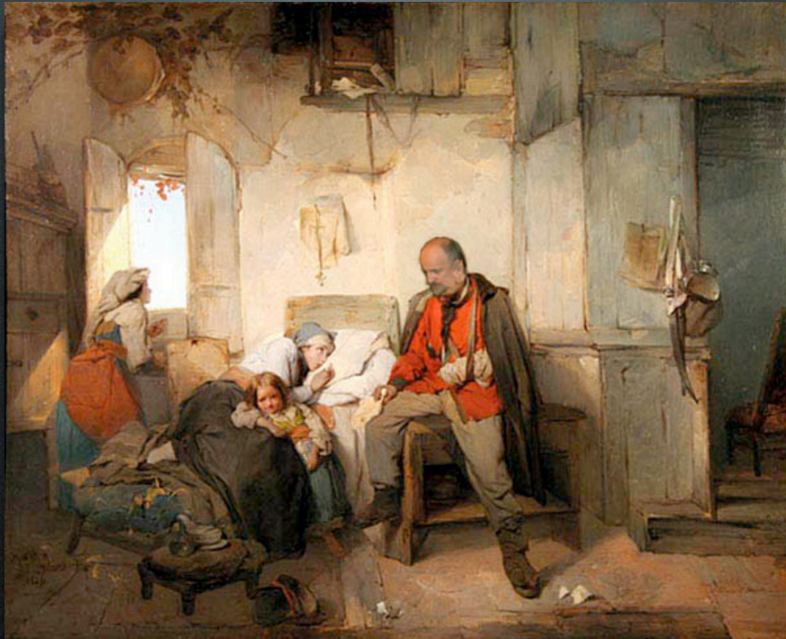
Domenico Induno - Il richiamo di Garibaldi (1854)