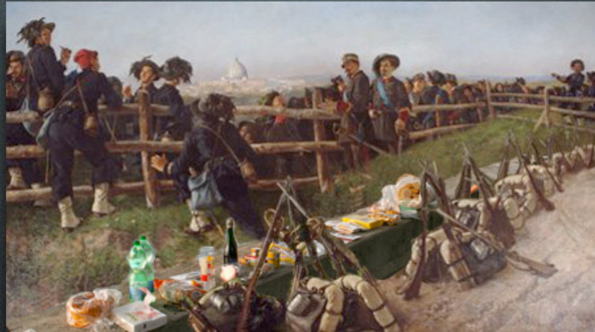
Michele Cammarano - Picnic dei bersaglieri (1915)