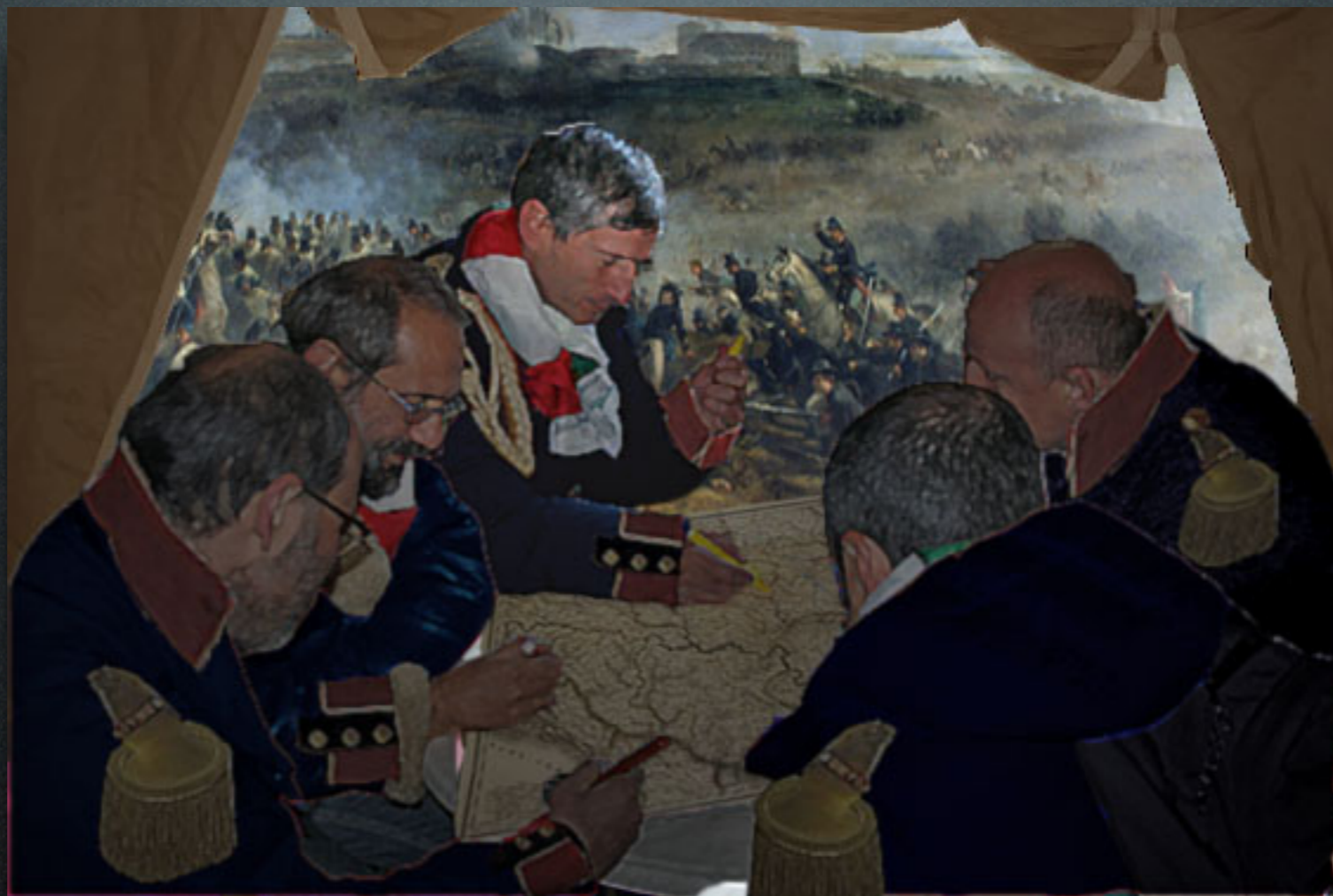
Anonimo - Sogni di vittoria alla Battaglia di San Martino (1859)