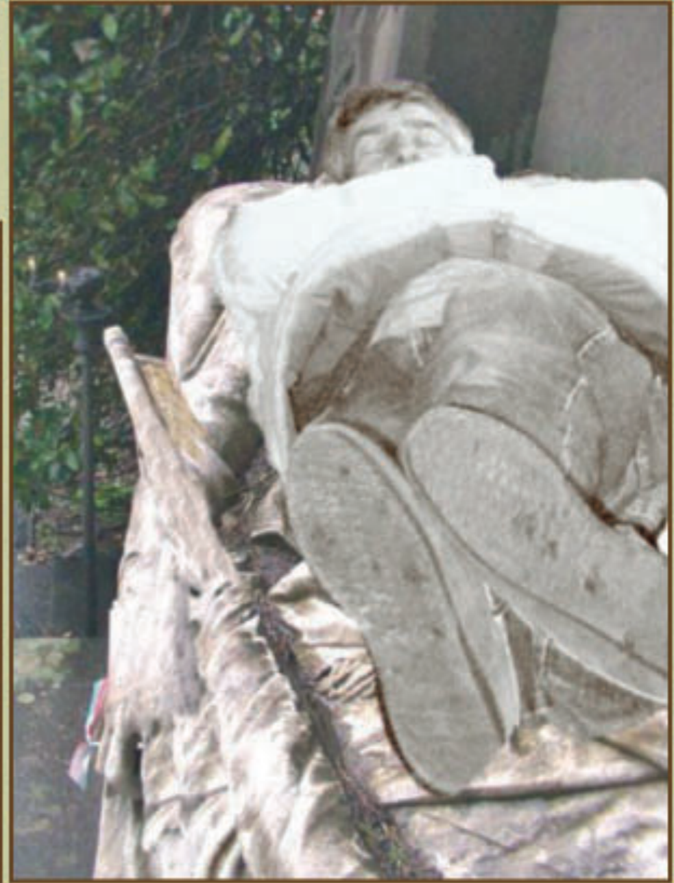
Luciano Campisi - Monumento funebre a Goffredo Mameli (1891)