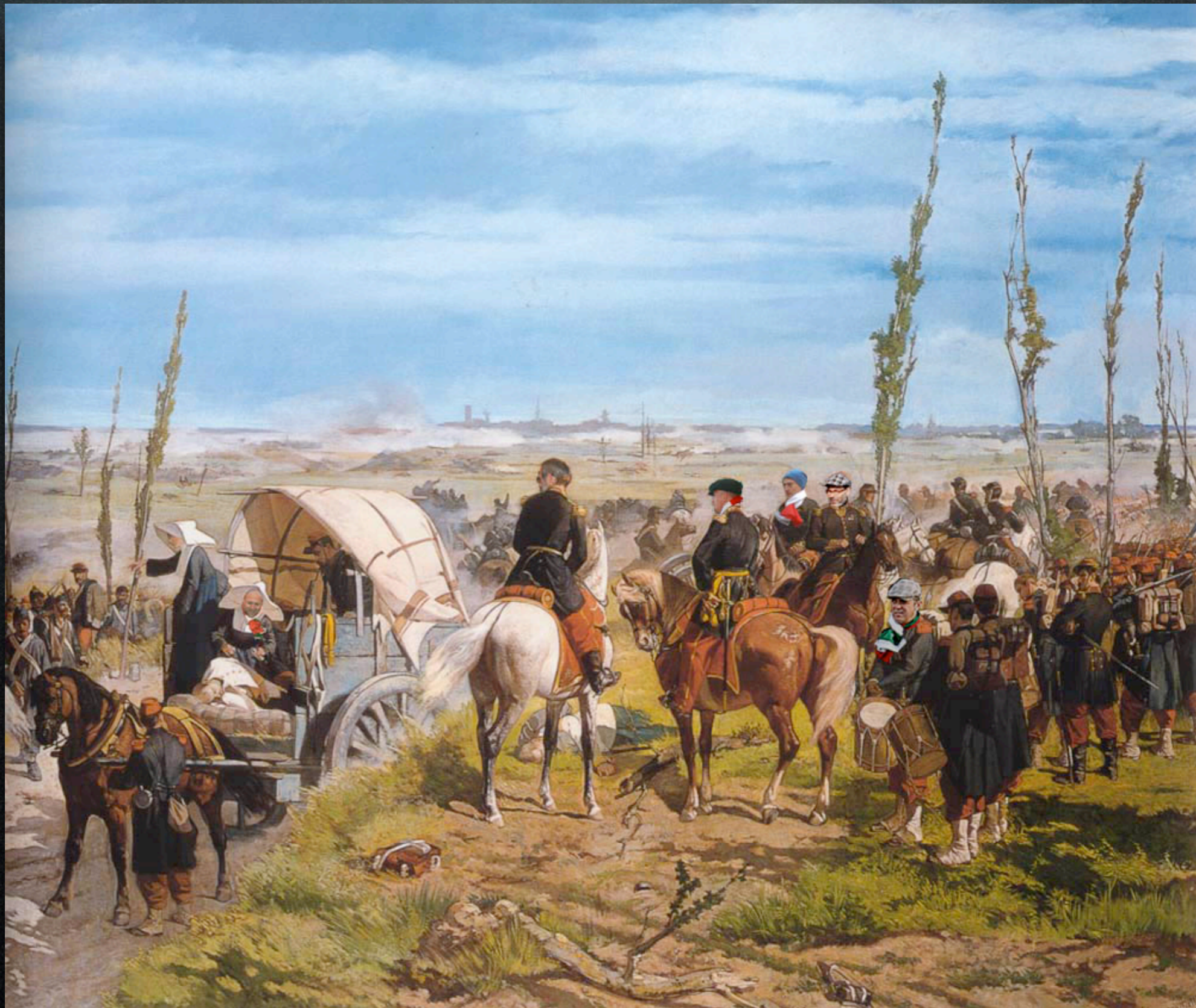
Giovanni Fattori - Battaglia di Magenta (1861)