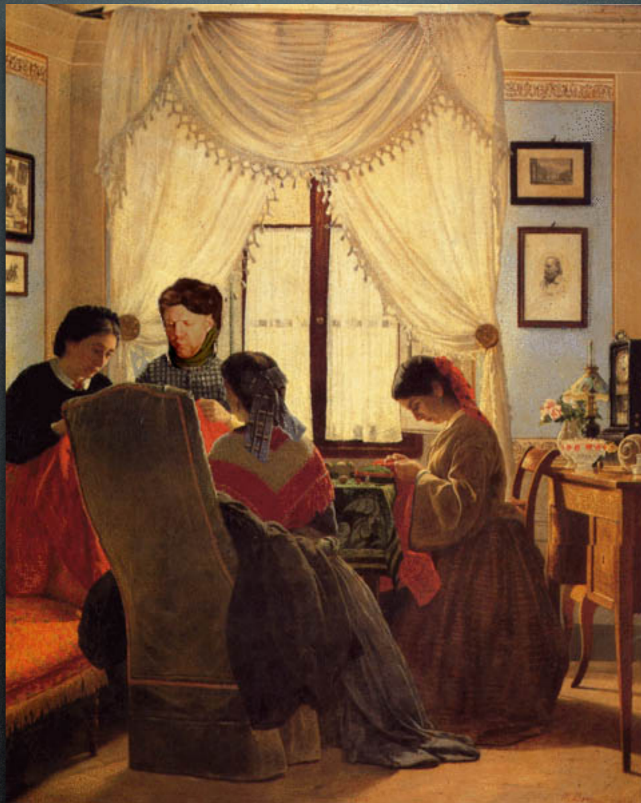
Odoardo Borrani - Le cucitrici di camice rosse (1863)